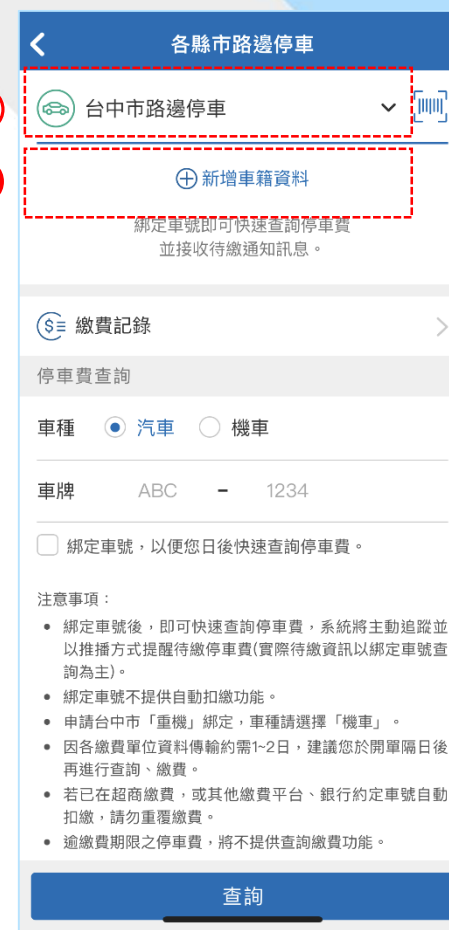
3. 選擇「台中市路邊停車」 ，新增車籍資料